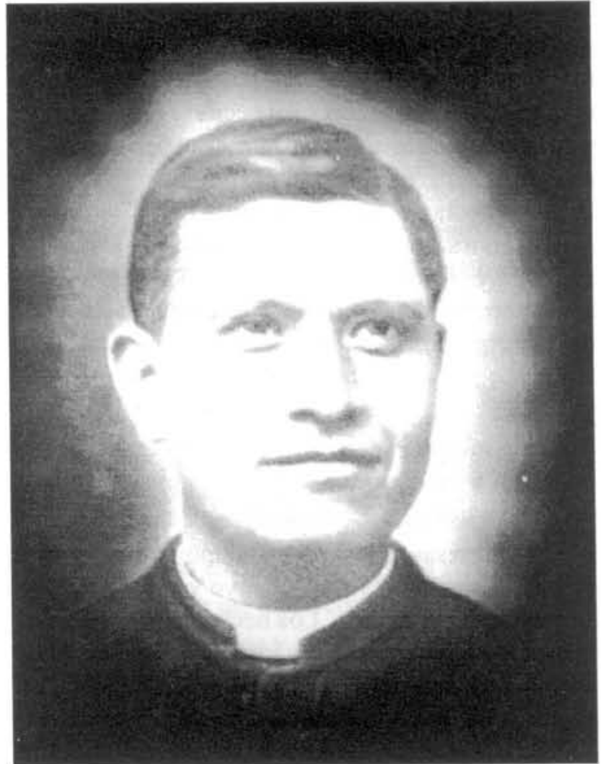
Beato Padre Pedro Esqueda Sacrificado en Teocaltitán