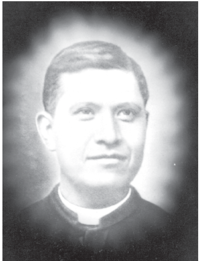
Beato Padre Pedro Esqueda Sacrificado en Teocaltitán